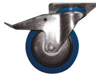
Roues en caoutchouc bleu non tâchant, silencieuses et jantes avec par-fils