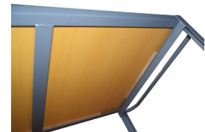
Equipée de renforts acier