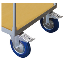
Deux roues pivotantes avec frein