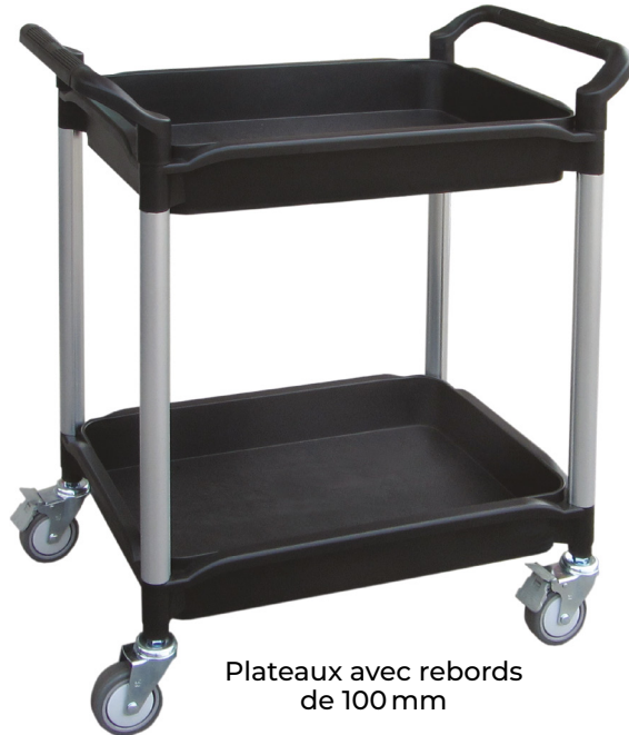
Plateaux avec rebords de 100 mm