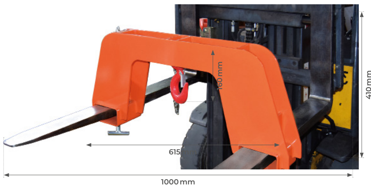
Dimensions des fourreaux